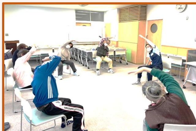
別の会場で行った教室の様子です